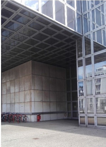
Seiteneingang, Zutritt zum Gebäudeteil D